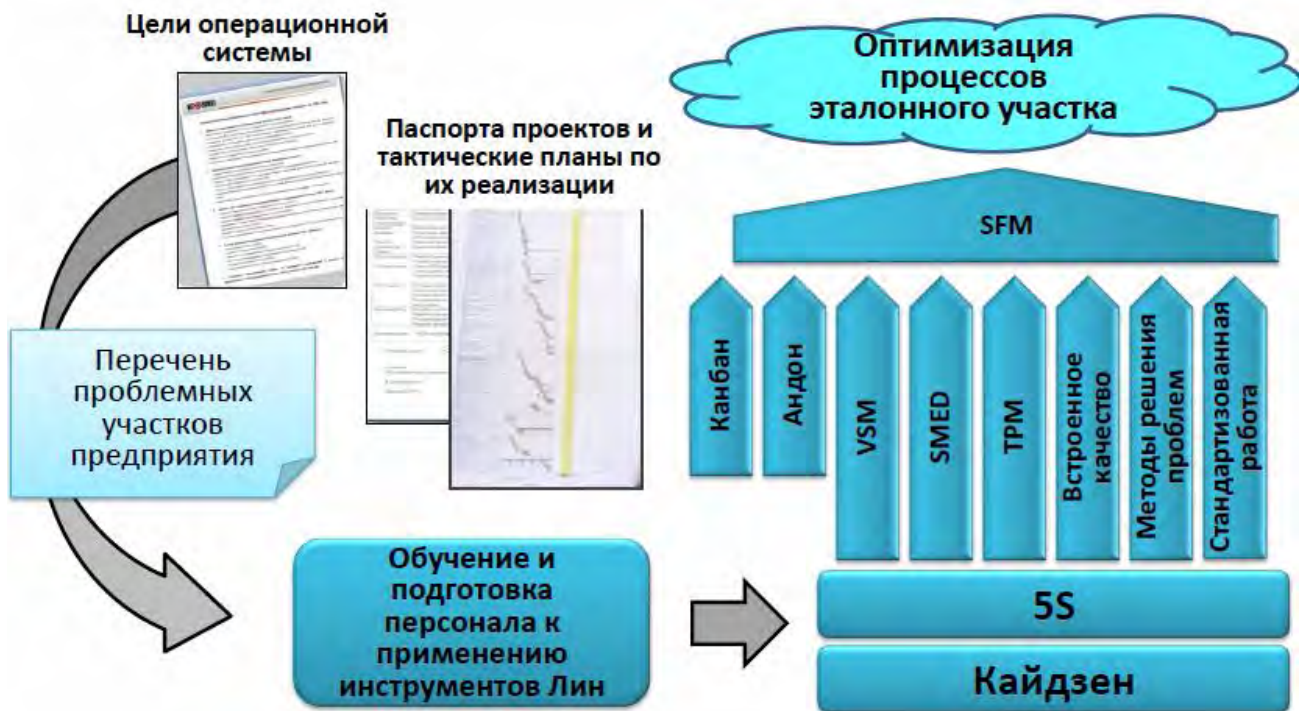
Рис. 3. Содержание деятельности на эталонных участках

Содержание деятельности на эталонных участках приведено на рис. 3.