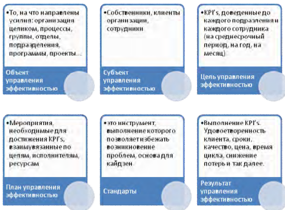
Рис. 1. Содержание управления эффективностью деятельности

В основе управления эффективностью – KPI's, которые собственники согласовывают с заинтересованными участниками и стремятся довести до каждого уровня на предприятии, то есть трансформировать стратегию в действия, а также использовать анализ для поиска причинно-следственных связей, которые, будучи осмысленными, помогают в принятии обоснованных решений. Особое внимание необходимо уделить интеграции организационных, групповых и индивидуальных целей.